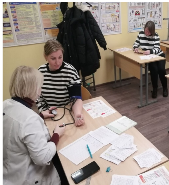
УЗ «Осиповичская ЦРБ»